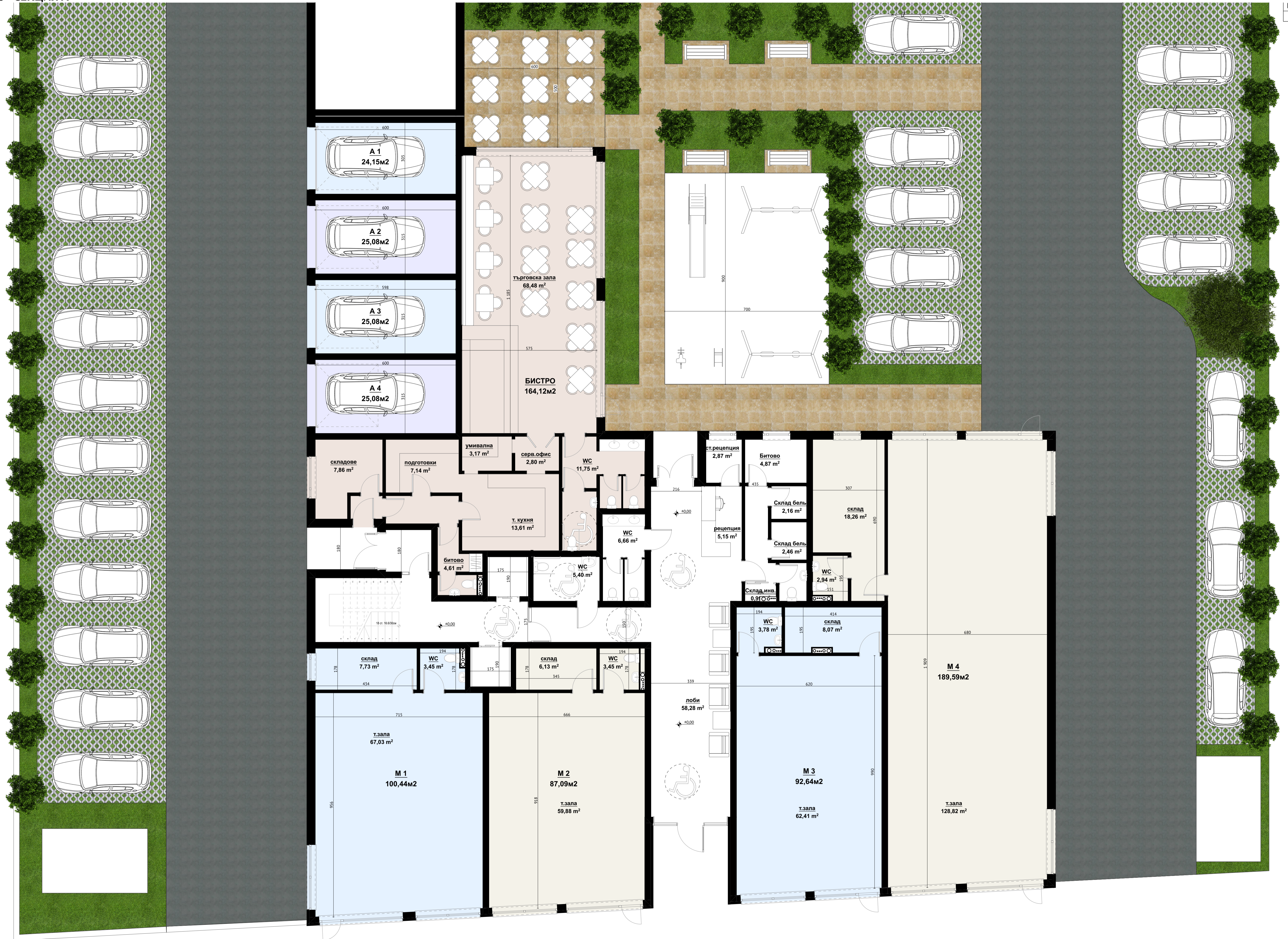
1. ПЪРВИ ЕТАЖ (кота ±0.00) - М 1:75